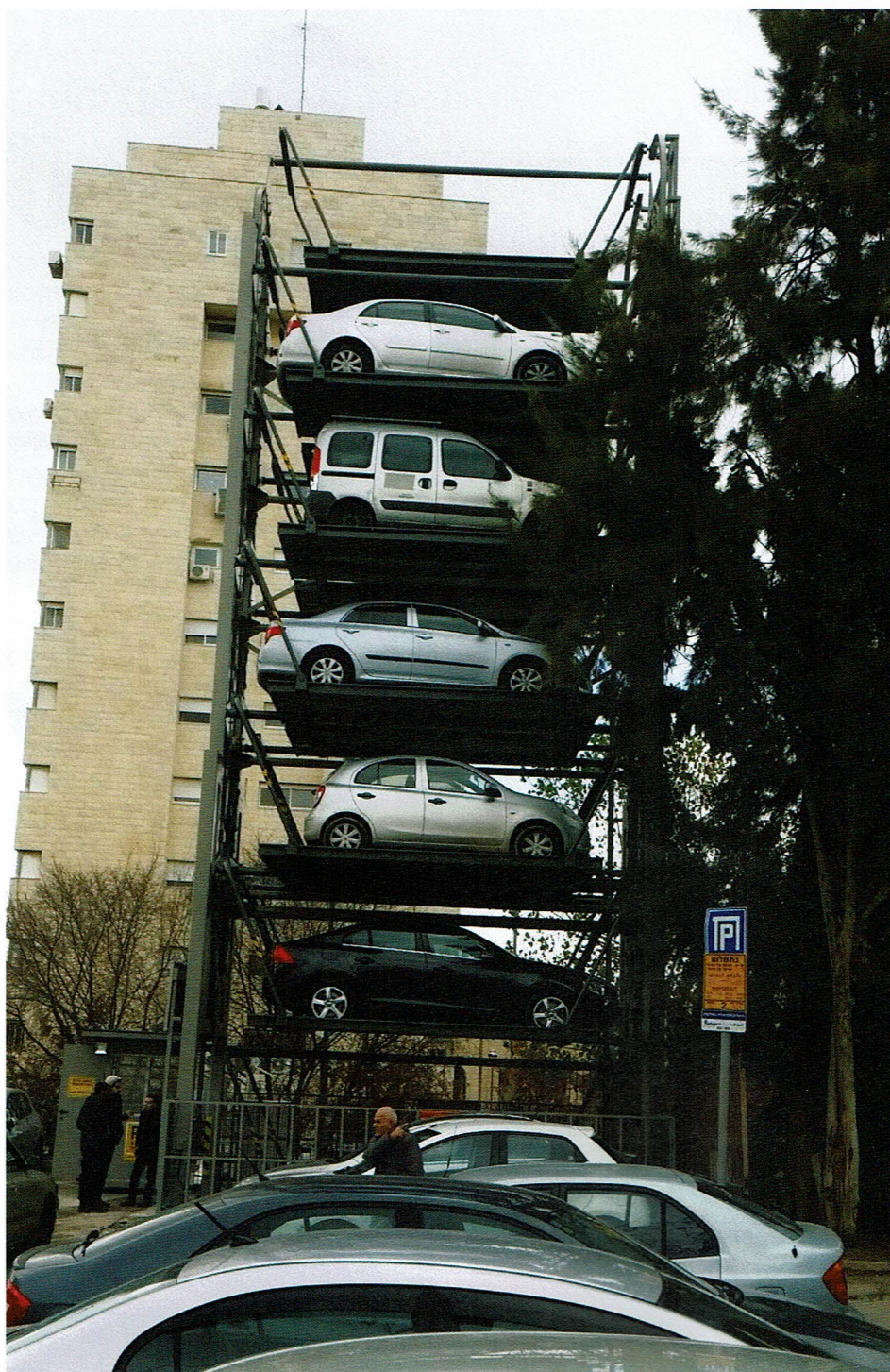
מתקן החניה בירושלים. הפיילוט הצליח. המתקן יורחב